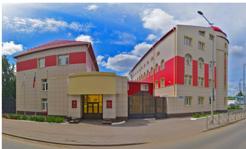
Внешний вид здания в настоящее время

2-х этажное здание в ходе реконструкции в 2015 году