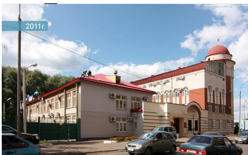
Внешний вид указанного 2-х этажного здания до реконструкции

К проверке представлена выписка из ЕГРН от 15.01.2021, согласно которой нежилое административное здание с кадастровым номером 16:50:011415:3675 общей площадью 990,6 кв.м имеет 2 этажа.