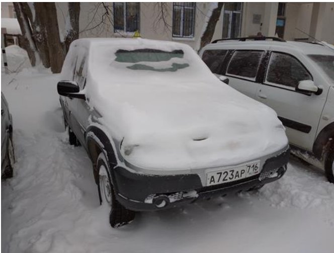
Chevrolet Niva (гос.номер A723AP 116RUS)