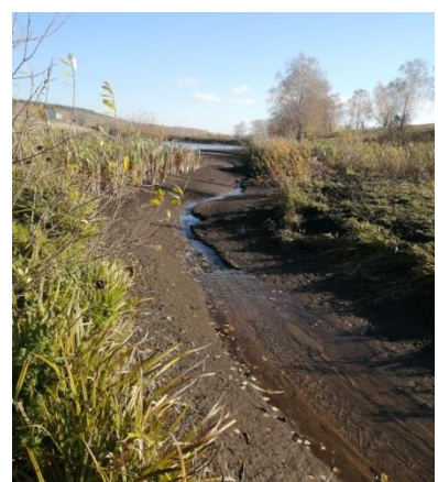
РТ,Подгорненское СП, зем. участок 16:13:140827:287 водный объект на ручье Безымянном, приток реки Соколка

Постановлением Исполнительного комитета Бугульминского муниципального района от 28.04.2023 № 210, руководствуясь п.п. 19 п. 2 ст. 39.6, ст. 39.8 Земельного