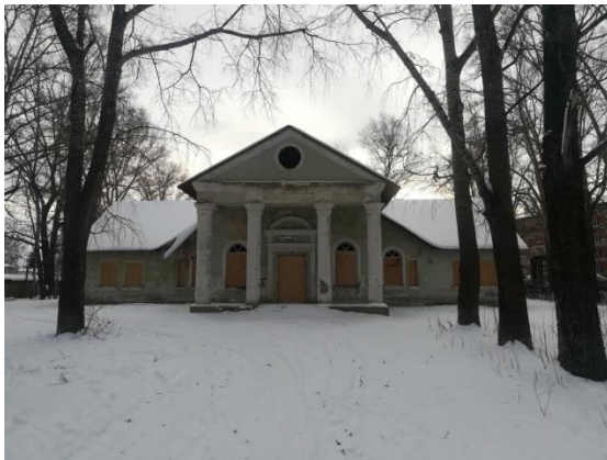
Здание, ул. Горького, д. 12