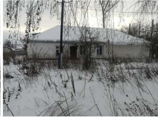
Нежилое здание, ул. Якупова, д. 38