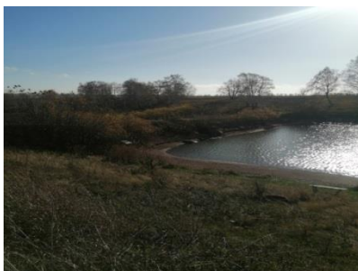
РТ,Подгорненское СП, зем. участок_16:13:140827:287 водный объект на ручье Безымянном, приток реки Соколка

С учетом изложенного, водотоки находятся в федеральной собственности. Так же на данный земельный участок в адрес Палаты земельных имущественных отношений был направлен отказ (исх. №2348 от 26.10.2022) о возможности формирования прав на данный земельный участок.