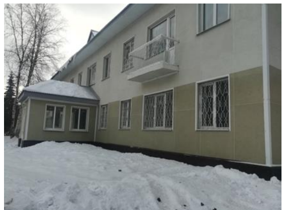
Нежилое здание, ул. Вахитова, д. 1