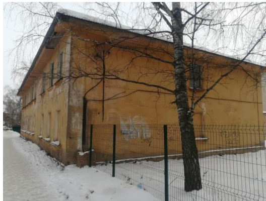
Нежилое здание (гинекологическое отделение), ул. Ленина, д. 88