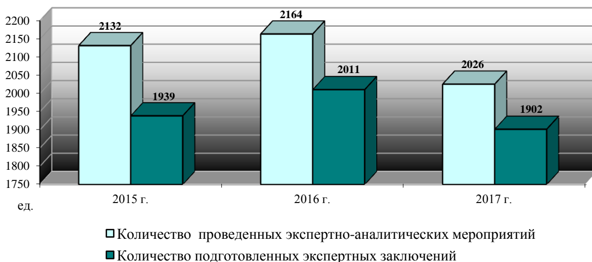
Динамика экспертно-аналитических мероприятий, проведенных муниципальными контрольно-счетными органами

В рамках деятельности Совета в течение отчетного периода проводился мониторинг численности сотрудников контрольно-счетных органов муниципальных образований республики.