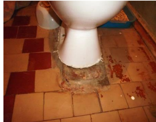
Неправильное крепление унитаза - унитаз может треснуть.