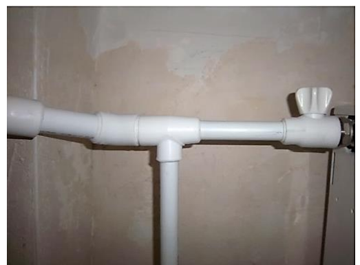
Заужение диаметра подводки к отопительному прибору - ухудшение проходимости теплоносителя, радиатор не прогревается.