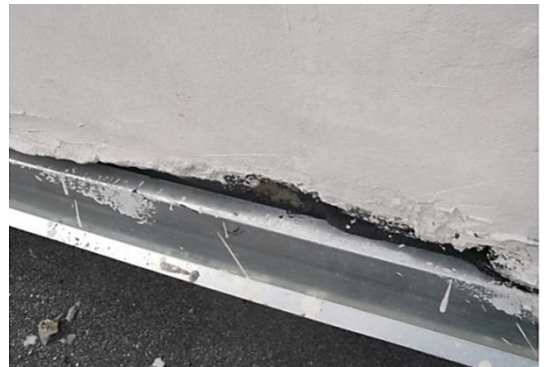
Примыкание фартука к стене вентиляционного канала не обработано герметиком