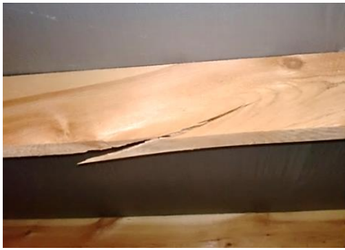
Треснутая стропильная нога - ослабление стропильной системы, обрушение кровельного покрытия.