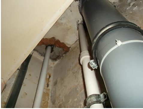
Незачеканенные гильзы - повреждение трубы вследствие трения о гильзу.