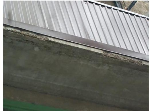
Обрамление балкона без восстановления балконных плит - приводит к разрушению балконной плиты, нарушение безопасности жизнедеятельности людей.