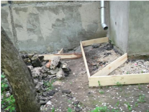
Отмостка выполняется без устройства планировки - возникновение контруклона, намокание цокольной части здания.