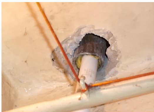
Гильзы не окрашены - коррозия металла, ухудшение прохождения труб.