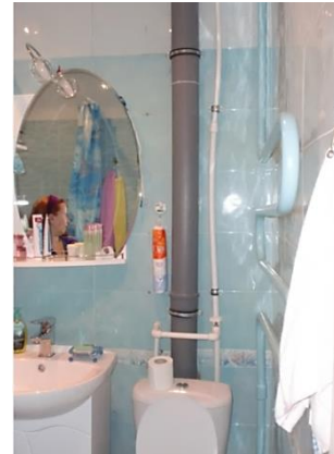
Кривой стояк - возникновение трещин и разрыв трубы в сварных швах.