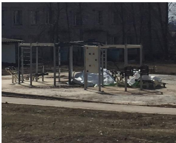
На спортивной площадке в с. Пестрецы не смонтирован комплект оборудования

В ходе аудита эффективности реализации мер по созданию условий населению для занятия физической культурой и спортом, массовым спортом, в том числе повышения уровня обеспеченности спортивными объектами в рамках реализации национального проекта «Демография» установлено, что на различных спортивных объектах (спортивная площадка в с. Пестрецы, физкультурно-оздоровительный комплекс в г. Набережные Челны, спортивный зал в пгт. Васильево Зеленодольского муниципального района Республики Татарстан) не смонтированы и не использовались комплекты оборудования стоимостью 10 268,6 тыс. рублей.