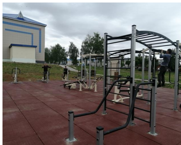
Хисап палатасы тикшерүе нәтижәләре буенча жиһазлар монтажланды

«Татарстан Республикасы Сәламәтлек саклау министрлыгының Республика туберкулезга каршы клиник диспансеры» ДАССУ се озак вакыт дәвамында гомуми бәясә 37 341,7 мең сум булган дәүләт милкен (административ биналар, лаборатория бинасы, флюорография жиһазлары белән жиһазландырылган автомобильләр, медицина жиһазлары һәм медицина билгеләнешендәге әйберләр) файдаланылмый.