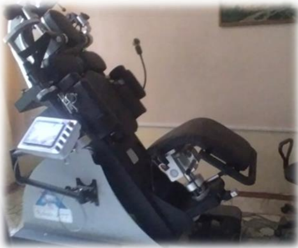
Robotic АТТ тернәкләндерү физиотерапия аппараты

(күчемсез милек, медицина жиһазлары, автотранспорт, оргтехника) хужалык әйләнешенә жәлеп итү буенча чаралар кулланмаган.