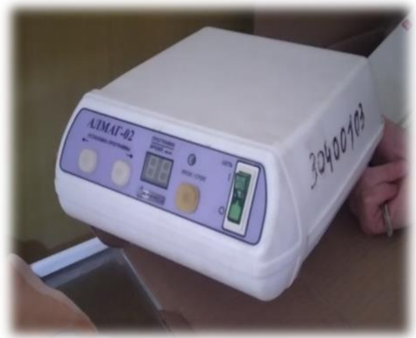
Алмаг-02 магнитотерапия аппараты

«Татарстан Республикасының инженерлык челтәрләре баш идарәсе» дәүләт казна учреждениесенең финанс булмаган активларына кертемнәр составында ике елдан артык бәясе 222 293,7 мең сум булган су белән тәмин итү объектлары төзелеш тәмамланган дип санала, шулай ук бәясе 1 253,2 мең сум булган проект-тикшеренү эшләре бар, әмма алар буенча төзелеш гамәлгә ашырылмый. Эксплуатацияләүче оешмаларга төзелеп беткән объектларны тапшыруның озак вакытлары аларны хужалык әйләнешенә үз вакытында жәлеп итүгә комачаулый, шулай ук тиешле хокукый нигезләрсез файдалану куркынычына китерергә мөмкин.